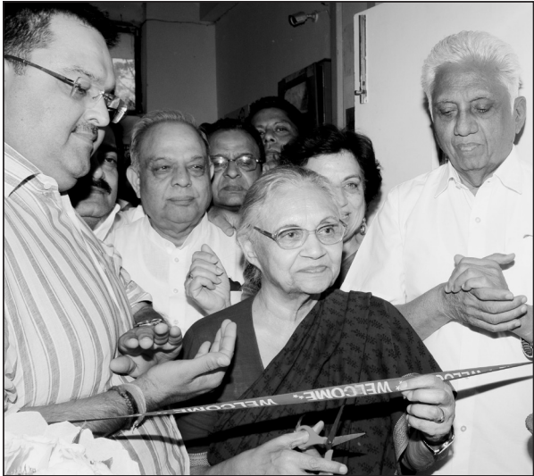
दिल्ली प्रदेश अध्यक्ष श्रीमती शीला दीक्षित ने राजीव भवन में लोकसभा चुनाव के लिए कंट्रोल रूम का उद्घाटन किया।

दिल्ली प्रदेश कांग्रेस कमेटी की अध्यक्ष श्रीमती शीला दीक्षित ने आज प्रदेश कांग्रेस कार्यालय राजीव भवन में लोकसभा चुनावों के लिए कंट्रोल रूम का उद्घाटन किया। प्रदेश कांग्रेस में गठित कंट्रोल रूम दिल्ली के सभी सातों सीटों पर कांग्रेस के लोकसभा उम्मीदवारों के कंट्रोल रूमों से कॉऑर्डिनेट करेगा और कांग्रेस उम्मीदारों से सम्बन्धित चुनाव प्रचार की जानकारी उपलब्ध कराएगा। कंट्रोल रूम में सभी सातों सीटों के अलग-अलग काउंटर बनाए गए हैं, प्रत्येक संसदीय सीट की जानकारी उपलब्ध कराएंगे। जिसमें उम्मीदवारों को चुनाव प्रचार का कार्यक्रम, उनकी बैठक व अन्य कार्यक्रम शामिल होंगे। कंट्रोल रूम में किसी भी प्रकार की शिकायतों को सुनने और सुलझाने के लिए एक टीम का गठन किया गया है। कंट्रोल में वकीलों का एक लीगल डेस्क