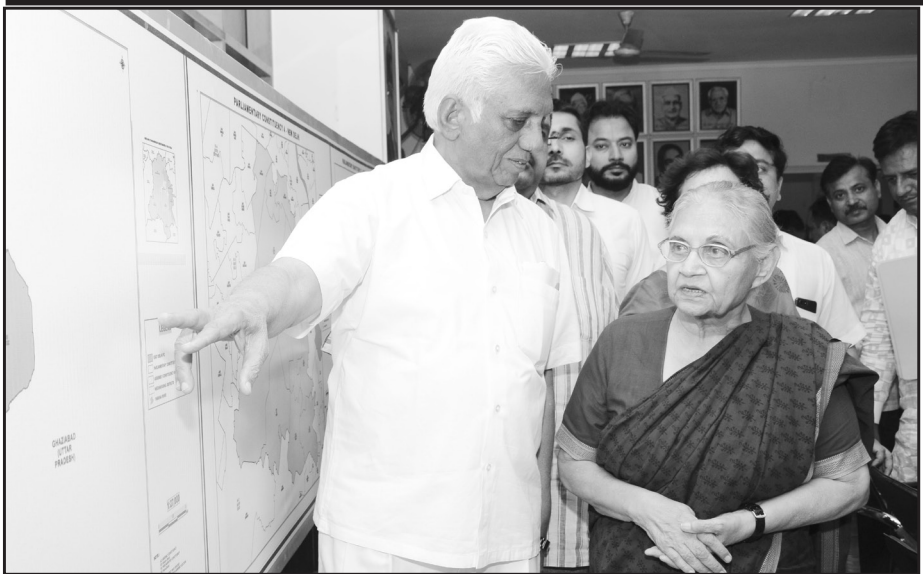
DPCC President Smt. Sheila Dikshit inaugurating control room for Lok Sabha Elections at Rajeev Bhawan.